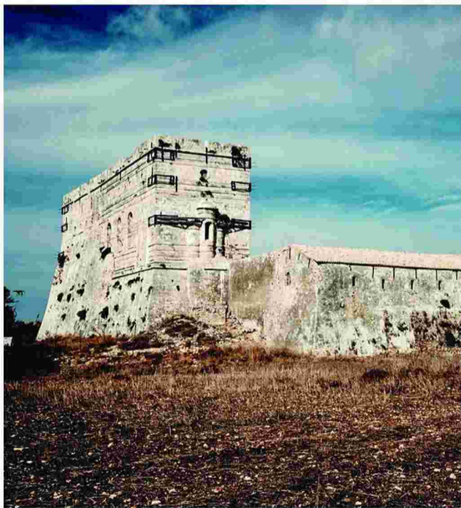
Το ιστορικό καστρομοναστήρι με το μοναδικό παράδειγμα «οχυρωμένης εκκλησίας» στον ορθόδοξο κόσμο.