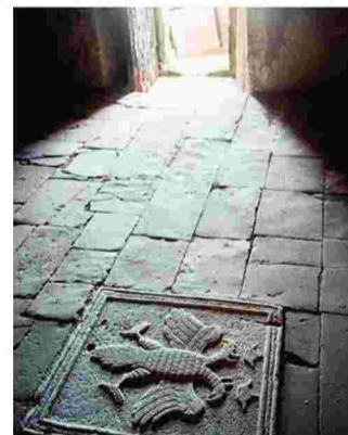
Ο ανάγλυφος δικέφαλος αετός στο δάπεδο του πύργου.

Και πού έγκειται η μοναδικότητα του μοναστηριού; «Η σταυροειδική -να μια λέξη που έμαθα πρό-