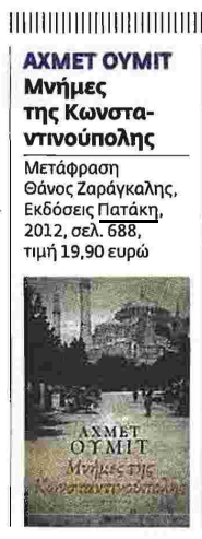
ΑΧΜΕΤ ΟΥΜΙΤ Μνήμες της Κωνσταντινούπολης Μετάφραση Θάνος Ζαράγκαλης, Εκδόσεις Πατάκη, 2012, σελ. 688, τιμή 19,90 ευρώ

Μέσα από μια αστυνομική ιστορία ο τούρκος συγγραφέας Αχμέτ Ουμίτ μιλάει για το παρελθόν και το παρόν της αγαπημένης του Κωνσταντινούπολης