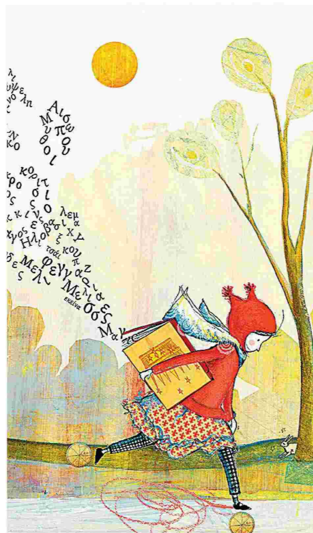
«Ο ψίθυρος», «Το τέρας της βροχής» (δεξιά επάνω) και η «Χαριστική Βιβλιοθήκη» (κάτω) είναι τρία από τα πιο αξιοπρόσεκτα βιβλία της χρονιάς για παιδιά.

Για όλα αυτά ο Σοφοκλής σίγουρα μπορεί να συζητήσει με τη μικρή ηρωίδα του βιβλίου της Πά-