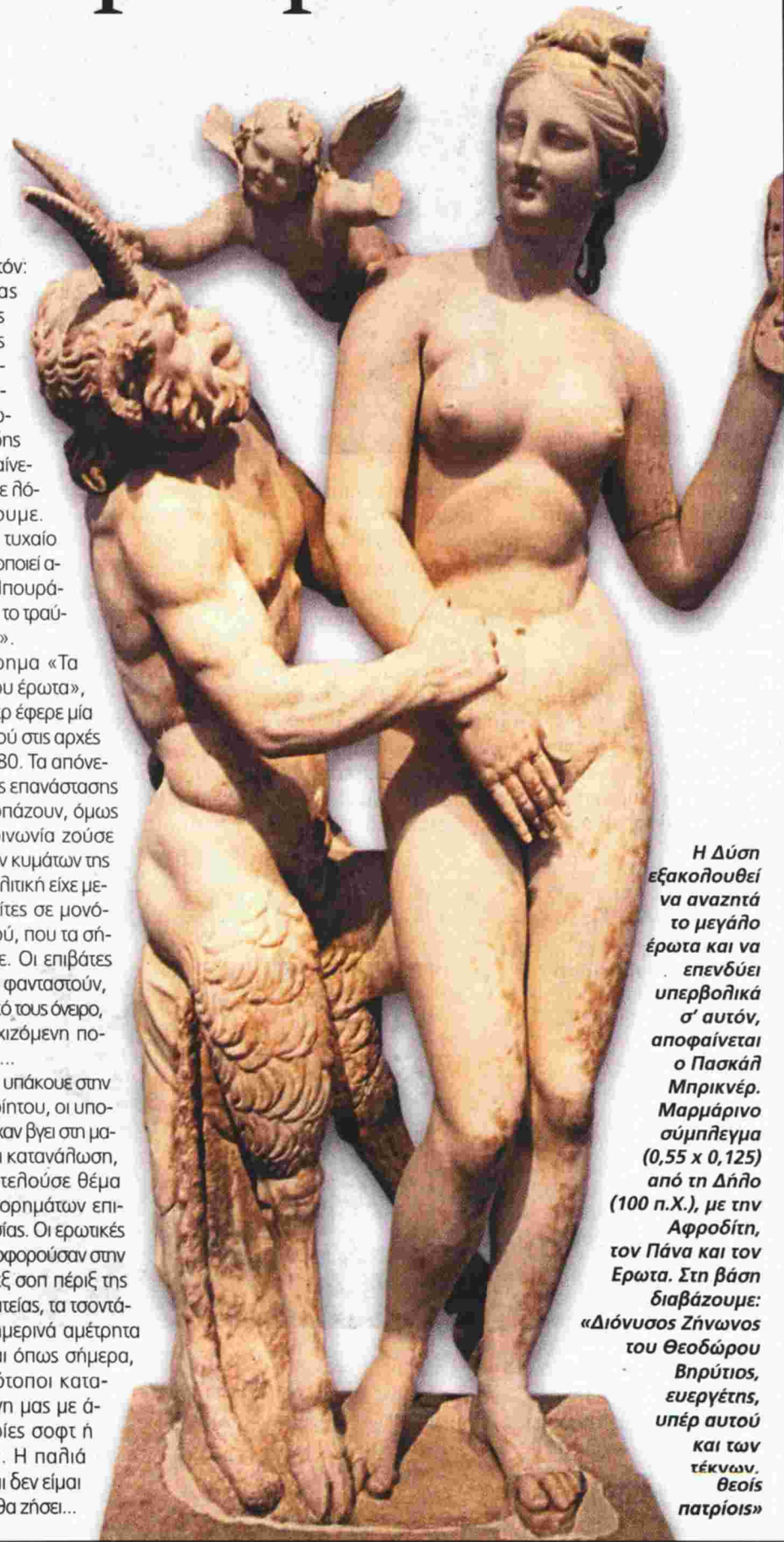
Η Δύση εξακολουθεί να αναζητεί το μεγάλο έρωτα και να επενδύει υπερβολικά σ' αυτόν, αποφαίνεται ο Πασκάλ Μπρικνέρ. Μαρμάρινο σύμπλεγμα (0,55 x 0,125) από τη Δήλο (100 π.Χ.), με την Αφροδίτη, τον Πάνα και τον Έρωτα. Στη βάση διαβάζουμε: «Διόνυσος Ζήνωνος του Θεοδώρου Βηρύτιος, ευεργέτης, υπέρ αυτού και των τέκνων, θεοίς πατρίοις»