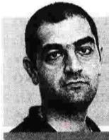
ΣΥΝΕΝΤΕΥΞΗ ΣΤΟΝ ΔΗΜΗΤΡΗ ΔΟΥΓΚΕΡΙΔΗ

Α πό το 2015, όταν κυκλοφόρησε η βιογραφία του Στάλιν στις Πανεπιστημιακές Εκδόσεις του Γέιλ, το όνομα του Ολεγκ Χλεβνιούκ μπαίνει μονίμως στην παγκόσμια βιβλιογραφία για τον σοβιετικό δικτάτορα ως έργο ζωής δύο δεκαετιών. Η συγγραφή μόνο ανέφελη δεν ήταν για τον επικεφαλής ερευνητικό εταίρο στο Διεθνές Κέντρο για την Ιστορία και την Κοινωνιολογία του Β' Παγκοσμίου Πολέμου και των συνεπειών του της Ανώτατης Σχολής Οικονομικών Επιστημών του Εθνικού Ερευνητικού Πανεπιστημίου της Ρωσίας. «Η ενασχόληση