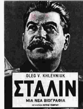
Oleg V. Khlevniuk ΣΤΑΛΙΝ ΜΙΑ ΝΕΑ ΒΙΟΓΡΑΦΙΑ

Ήταν κι αυτό μία όψη του κυνικού πραγματισμού του. Επιδίωξε να συμμαχήσει με τον Χίτλερ όταν θεώρησε ότι θα έχει προνόμια σε νέα εδάφη και στη χάραξη της εξωτερικής πολιτικής. Ηλπιζε ότι η Σοβιετική Ένωση θα απέφυγε τον παγκόσμιο πόλεμο και θα αναδυόταν ισχυρότερη μετά την καταστροφή των εμπόλεμων χωρών, όπως η Γερμανία και η Βρετανία. Ακολούθησε δηλαδή και πάλι η Realpolitik. Αν οι ΗΠΑ ή η Βρετανία τού πρόσφεραν