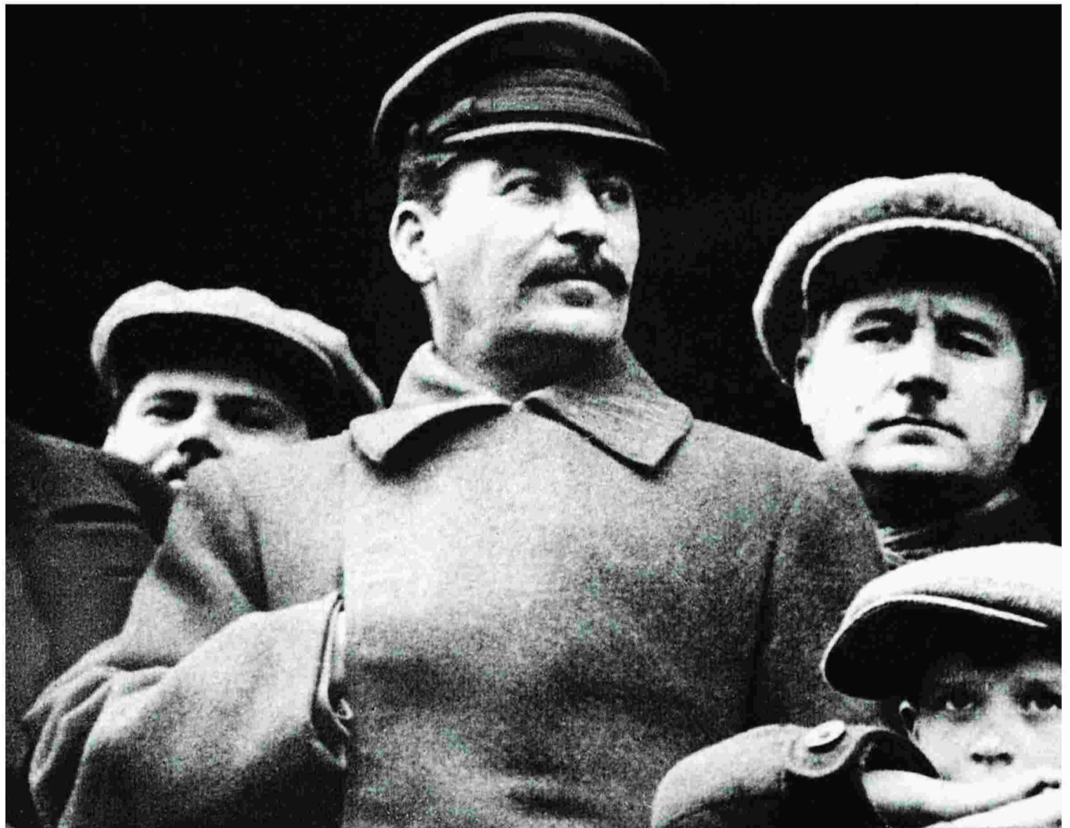
Στάλιν: ηγέτης με σιδηρά πυγμή, που από ασήμαντος επαναστάτης έγινε ένας από τους πιο ισχυρούς ανθρώπους της Ιστορίας.

Η σύγκρουση των επιφανέστερων της Ρωσικής Επανάστασης ήταν σφοδρή. Δάσκαλος και μαθητής.