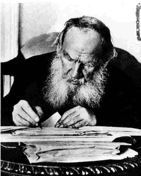
Ο Μαξίμ Γκόρκι (1868-1936) έγραψε τους «Αρταμάνοφ» το 1925.

εται τον γιο του κόμη Ρόσμωρ νομίζοντας τον φτωχό. Διότι, φτάνοντας στην Αμερική και κάνοντας τα χρήματά του σε μια φωτιά, φο-