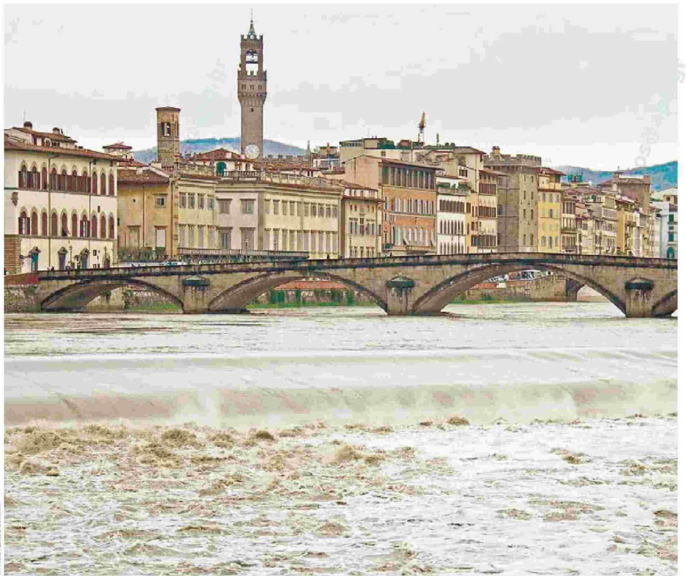
Η γοητευτική Φλωρεντία είναι ο τόπος που έδρασε και δημιούργησε ο Νικολό Μακιαβέλι, τον 16ο αιώνα. Το βιβλίο είναι και μια διαφορετική ματιά στην ιστορία της πόλης, στην πάλη ανάμεσα στις οικογένειες που διεκδικούσαν τον έλεγχο της πόλης και της οικονομίας της.

Όταν δημιούργησε τη δική του οικογένεια, υπογράμμισε στον γιο του, Γκουίντο, τη μεγάλη σημασία που είχε η μελέτη της μουσικής και των ουμανιστικών επιστημών, «καθώς αυτές του προσέφεραν τη λίγη εκτίμηση της οποίας ίσως απολαμβάνω». Νωρίτερα, σ' ένα σονέτο του προς τον Τζιουλιάνο ντε Μέντιτσι, το οποίο γράφτηκε στη φυλακή, ο Νικολό περιέγραφε τον εαυτό του ως ποιητή, και το 1517 γκρίνιαζε στον Λουντοβίκο Αλαμάνι, επειδή ο διάσημος ποιητής Λουντοβίκο