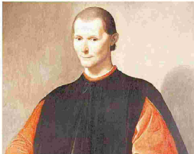
Νικολό Μακιαβέλι. Εξακολουθεί να συζητείται και να παρεξηγείται.

Αρίστο είχε παραλείψει να συμπεριλάβει το όνομά του στους ποιητές που παρέθετε στο έργο του Orlando Furioso, «αγνοώντας με λες και είμαι κανένας άχρηστος».