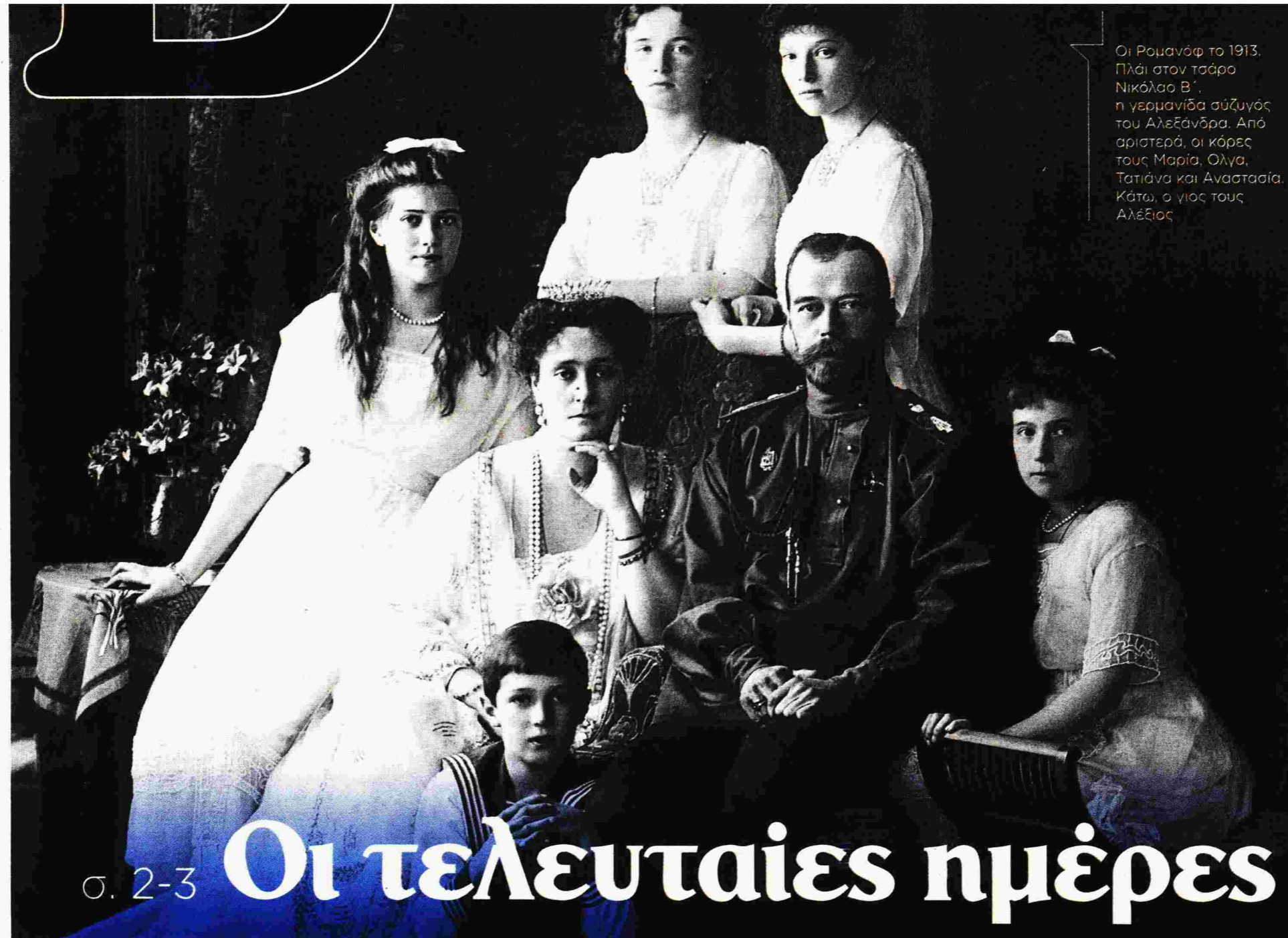
Οι Ρομανόφ το 1913. Πλάι στον τσάρο Νικόλαο Β', η γερμανίδα σύζυγός του Αλεξάνδρα. Από αριστερά, οι κόρες τους Μαρία, Ολγα, Τατιάνα και Αναστασία. Κάτω, ο γιος τους Αλέξιος