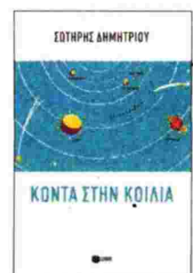
Σωτήρης Δημητρίου ΚΟΝΤΑ ΣΤΗΝ ΚΟΙΛΙΑ Εκδ. Πατάκη, 2014, σελ. 104 Τιμή: 8 ευρώ

Σαν να μην του έφταναν οι παραμορφωτικοί καθρέφτες που συνιστούν εκ προοιμίου όλα όσα αναπαράγουν από μια δάνεια και άγνωστο πώς έχει συγκροτηθεί γλώσσα οι ανώνυμοι ήρωες του «Κοντά στην κοιλιά» – τα μέλη του Χορού της τραγωδίας –, ο Δημητρίου κατορθώνει να συνδέσει την καυτή καθημερινότητα που σημειώσαμε με ένα σύμπαν που, αν και η συνειδήσή μας αδυνατεί να το ελέγξει, γίνεται καθοριστικό για την άμορφη μάζα που συνιστούμε όλοι μας. Επομένως, αφού για την ίδια τη φύση τα χιλιάδες χρόνια ισοδυναμούν με το αναβοσβήσιμο της κωλοφωτιάς, η κρίση που την πρωτοέγραψε ένας υπάλληλος των ΔΕΚΟ ή την έκανε γκραφίτι μια ομάδα νεαρών είναι σαν να μην υπήρξε.