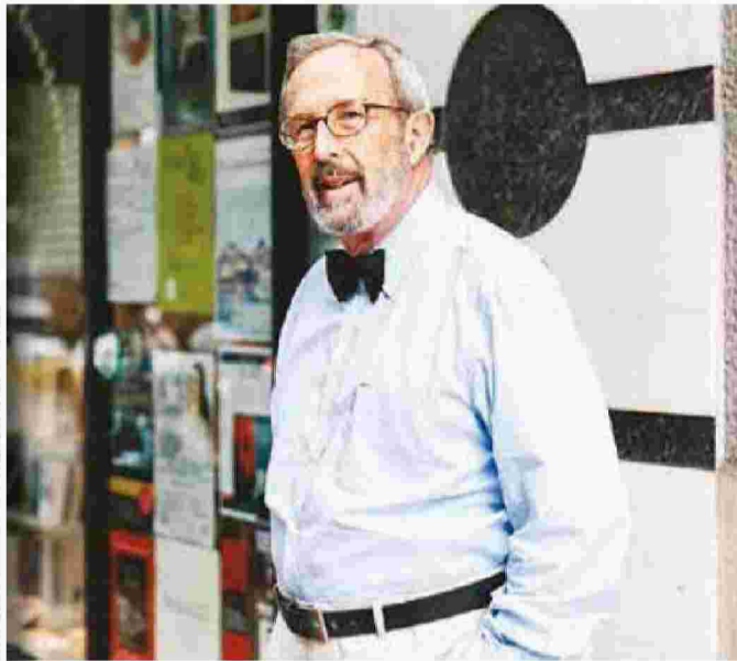
■ Ο ιστορικός και τ. καθηγητής του Πανεπιστημίου Αθηνών Γιώργος Θ. Μαυρογορδάτος.