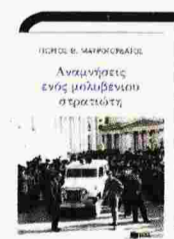
ΓΙΩΡΓΟΣ Θ. ΜΑΥΡΟΓΟΡΔΑΤΟΣ Αναμνήσεις ενός μολυβένιου στρατιώτη

Μετάφραση Ρίκα Μπενβενίστε. Εκδόσεις Πόλις, 2019, σελ. 256, τιμή 17,70 ευρώ