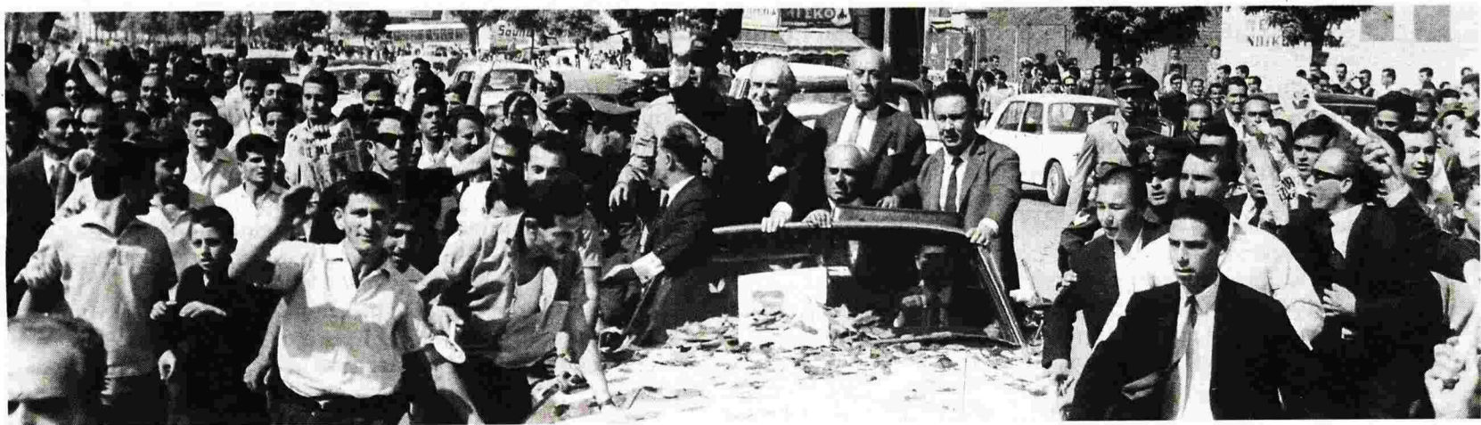
Ο Γεώργιος Παπανδρέου, όρθιος στο αυτοκίνητο, επευφημείται σε επίσκεψή του στη Θεσσαλονίκη

Στο βιβλίο του, προφανώς, κάποιοι ήρωες ξεχωρίζουν, για την ακρίβεια συμπρωταγωνιστούν. «Ο νεαρός Βλάσης είναι ένας ταλαιπωρημένος νεαρός, που χαιρέται το κοινόβιό του με παλαβούς φίλους και ξέμπαρκα κορίτσια σε τρελά γλέντια. Ζει στον χαρωπό του, φτωχό μικρόκοσμο. Ο Βεντήρης είναι η παλιά αριστοκρατία της Σαλονίκης και πολιτικά πανίσχυρος – με