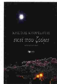
Χρίστος Κυθρεώτης «ΕΚΕΙ ΠΟΥ ΖΟΥΜΕ»