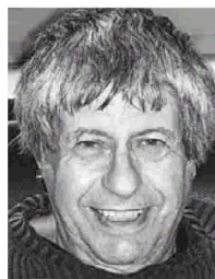
Την Τρίτη η εκδήλωση του Ιβαν Κλίμα.

Αλέν ντε Μπιοτόν, Ιβαν Ράνκιν, Ιβαν Κλίμα θα είναι στην ελληνική πρατεύουσα την επόμενη εβδομάδα.