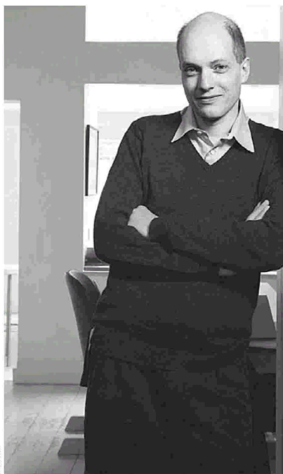
Περιζήτητος στους εκδότες όλου του κόσμου ο Αλέν ντε Μπιοτόν.

Δύο μέρες νωρίτερα, και στο πλαίσιο του Μηνιαίου Αστυνομικής Λογοτεχνίας που διοργανώνουν τα καταστήματα Public, θα έρθει στην Ελλάδα ο Σκωτσέζος συγγραφέας αστυνομικής λογοτεχνίας Ιβαν Ράνκιν με πολλά βιβλία και πολλούς φίλους στην Ελλάδα. Το τελευταίο του βιβλίο κυκλοφορεί από τις εκδόσεις «Μεταίχμιο» και έχει τίτλο «Με τις πόρτες ανοικτές». Ηρώας του είναι ένας αυτοδημιούργητος επιχειρηματίας με πολύ χρόνο στη διάθεσή του και «με τον διάβολο μέσα του» που αναζητά κάτι να τον συναρπάσει. Σε μια δημοπρασία του δίνει αυτή την ευκαιρία μια τυχάρπαστη γυναίκα. Εκεί του προτείνουν να διαπράξει το τέλειο έγκλημα. Χωρίς τον γνωστό επιθεωρητή Ρέμπους, ο Ιβαν Ράνκιν δεν κάνει απλά αστυνομική λογοτεχνία. Θι-