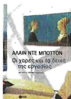
Alain de Botton ΟΙ ΧΑΡΕΙΣ ΚΑΙ ΤΑ ΔΕΙΝΑ ΤΗΣ ΕΡΓΑΣΙΑΣ ΜΤΦ. ΑΝΤΩΝΗΣ ΚΑΛΟΚΥΡΗΣ ΕΚΔ. ΠΑΤΑΚΗ, 2009

τικό: καλύτερα καταδεικνύει με τρόπο απτό, να περιγράφεις με χρώματα ζωηρά ή ζοφερά, από το να αναμασάς αυτόρεσκα αφηρημένες έννοιες. Ο πολυπράγμων Ντε Μπότον, γεννημένος στη Ζυρίχη, με γαλλικό όνομα και αγγλοσαξονική παιδεία (εμπειρισμός), είναι συγκεκριμένος. Τα δέκα αυτοτελή μικροδοκίμια του βιβλίου, που θυμίζουν ντοκιμαντέρ και θα μπορούσαν να είναι πέντε ή είκοσι, μιλάνε για διάφορους ετερόκλητους τομείς της σύγχρονης οικονομικής ζωής. Για τα μικρά πεζά πράγματα που κάνουν οι άνθρωποι για να ζήσουν και στα οποία ο φιλόσοφος εστιάζει, ζουμάροντας μέσα από ποικίλες κλειδαρότρυπες. Ως... εργασιοβλεψίας.