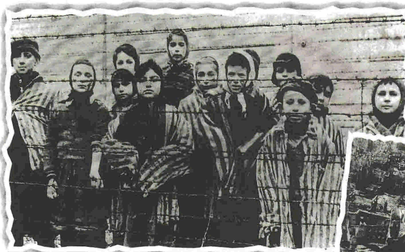
Πάνω, παιδιά που επέζησαν από το Άουσβιτς φωτογραφίζονται αμέσως μετά την απελευθέρωση του στρατοπέδου από σοβιετικούς στρατιώτες. Δεξιά, άποψη της Δρέσδης μετά τον βομβαρδισμό από τους Συμμάχους

μαντικότερους ιστορικούς για τον Β' Παγκόσμιο Πόλεμο μλά στα «ΝΕΑ»