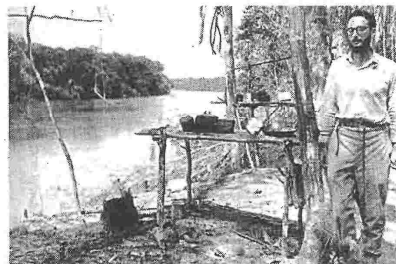
Νεαρός ανθρωπολόγος στη Βραζιλία του 1930. Οι εμπειρίες του γέννησαν τους «Θλιμμένους Τροπικούς» του 1955

Είχε πει το 2005: «Παρατηρώ τις καταστροφές που γίνονται. Την τρομακτική εξαφάνιση ζωντανών ειδών, είτε είναι ζώα είτε φυτά -αλλά και το ίδιο το γεγονός ότι ο ανθρώπινο είδος ζει σε ένα καθεστώς εσωτερικής πληθυσμιακής κρίσης. Σκέφτομαι το παρόν και τον κόσμο, στον οποίο τελειώνω τις μέρες μου. Και, ειλικρινά, δεν τον αγαπώ αυτόν τον κόσμο»