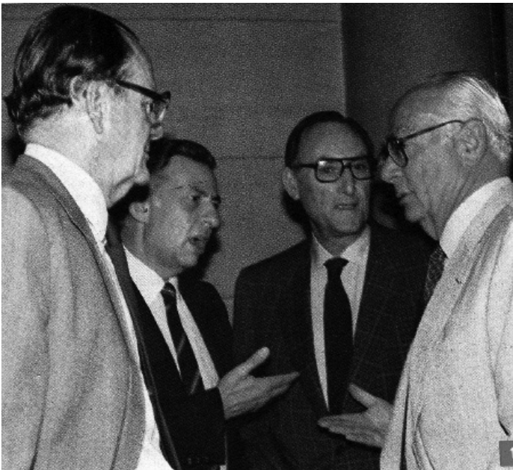
Λίγο προ των εκλογών, σε πηγαδάκι στους διαδρόμους της Βουλής. Εξ αριστερών: Γ. Πεσμαζόγλου, Γ. Βαρβιτσιώτης, Γ. Μπούτος, και ο πρωθυπουργός Γ. Ράλλης.

Το εκλογικό αποτέλεσμα του 1981 προκάλεσε αναστάτωση και στους στρατιωτικούς ηγέτες της χώρας, που είχαν αποφασίσει, όπως ήταν ήδη γνωστό σε πολιτικούς και δημοσιογραφικούς κύκλους, να εκφράσουν δημόσια τις διαφωνίες τους για την αντιδυτική εξωτερική πολιτική που διακήρυσσε ο αρχηγός του ΠΑΣΟΚ, και να υποβάλουν τις παραίτησές τους. Την εξέλιξη αυτή απέτρεψε ο Πρόεδρος της Δημοκρατίας, Κωνσταντίνος Καραμανλής, ο οποίος διεμήνυσε προς τους αρχηγούς των Επιτελείων την πλήρη διαφωνία του με το ενδεχόμενο παραίτησής τους. Έτσι η κυβερνητική αλλαγή πραγματοποιήθηκε, τελικώς, ομαλά.