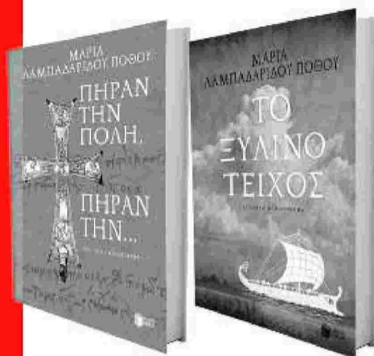
Το μυθιστόρημα της Μαρίας Λαμπαδαρίδου Πόθου, «Πήραν την Πόλη, πήραν την...», κυκλοφορεί σε εντυπωσιακή, ανανεωμένη μορφή από τις εκδόσεις Πατάκη ενώ επανεκδόθηκε και το «Ξύλινο τείχος»

Η κρίση θα πρέπει να μας έχει κάνει όλους λίγο πιο σοφούς. Και όχι μόνο τους συγγραφείς. Γιατί όλοι πονέσαμε. Πονέσαμε για τον τόπο μας.