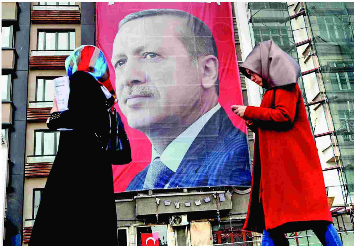
«Η ανελεύθερη Τουρκική δημοκρατία» του Νίκου Στέλγια έρχεται να προστεθεί στα -λίγα έως σήμερα- επιστημονικά βιβλία σχετικά με τη χώρα που κατέχει κεντρική θέση στην ελληνική εξωτερική πολιτική, στα οποία επικεντρώνεται να αναλυθεί το αποτύπωμα της διακυβέρνησης Ερντογάν.