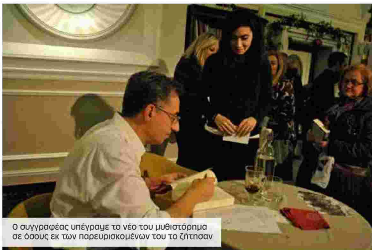
Ο συγγραφέας υπέγραψε το νέο του μυθιστόρημα σε όσους εκ των παρευρισκομένων του το ζήτησαν

«Μια Θεσσαλονίκη όπως την έχουμε κατά καιρούς ονειρευτεί, όπως την έχουμε απολαύσει σε ασπρόμαυρα βεσκώματα και παλιές φωτογραφίες και η οποία αναγεννιέται από την επιδέξια, εικονοπλαστική ικανότητα του συγγραφέα» όπως τόνισε και η κ.Ναούμ. «Πρόκειται για ένα έργο πολυσέλιδο, πολυπρόσωπο, όπως μπορείτε να υποθέσετε, με έναν κύριο χαρακτήρα ικανό να σηκώσει στους ώμους του μια ολόκληρη ζωή, ένα άρτια, ολοκληρωμένο βιβλίο» υπογράμμισε η ίδια για να επισημάνει πως «μέσα από το θεατρικό αυτό θαύμα που μας χαρίζει ο Ζουργός, κάθε λέξη έχει τη σημασία της, κάθε πρόταση δικαιολογεί επάξια το χώρο που καταλαμβάνει, κι ο ήρωας, το μικρό χαμίνι των δρόμων, μας έχει γραπώσει εγκαίρως απ' το σβέρκο παρακοιθωνάτος μαζί του σταματάει, πίσω από μια μισάνοιχτη πόρτα».