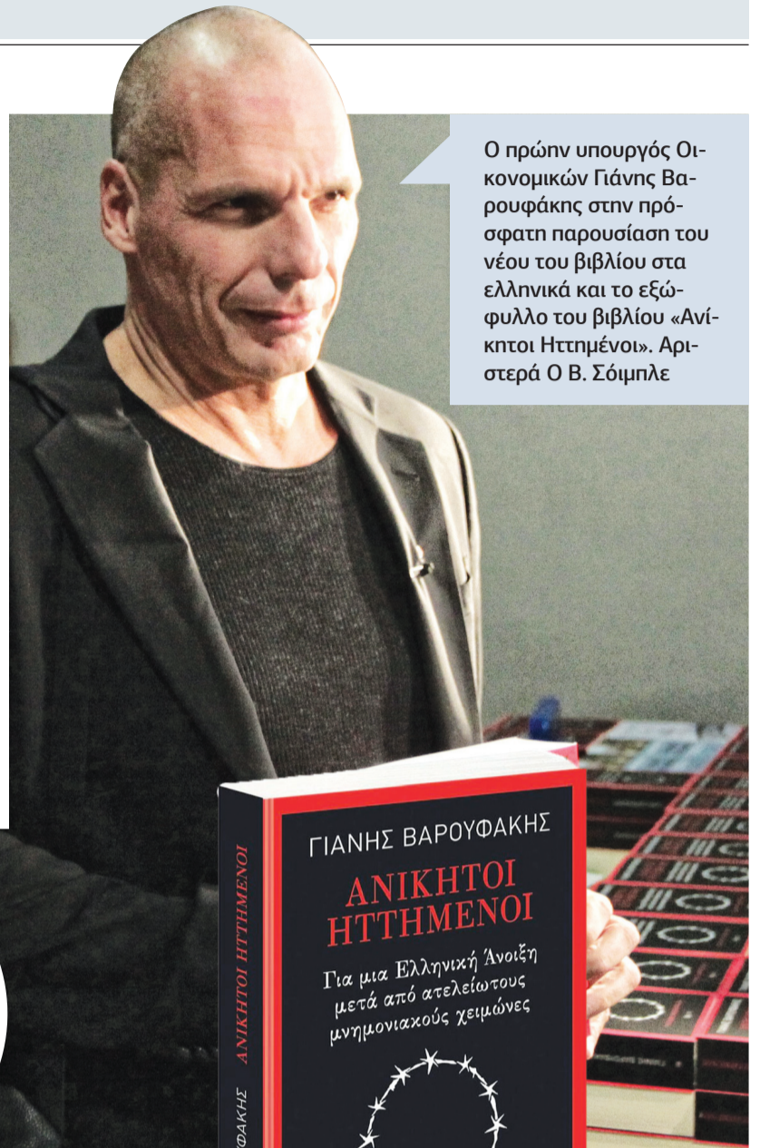
Ο πρώην υπουργός Οικονομικών Γιάνης Βαρουφάκης στην πρόσφατη παρουσίαση του νέου του βιβλίου στα ελληνικά και το εξώφυλλο του βιβλίου «Ανίκητοι Ηττημένοι». Αριστερά Ο Β. Σόιμπλε

Η στιχομυθία του Γιάνη Βαρουφάκη με τον Γερμανό ομόλογό του στην καταστροφική διαπραγμάτευση του 2015. Οι αποκαλύψεις στην ελληνική έκδοση του βιβλίου του