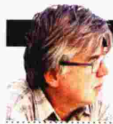
ΓΡΑΦΕΙ Ο ΓΙΩΡΓΟΣ ΣΙΑΚΑΝΤΑΡΗΣ

Σε λίγες εβδομάδες συμπληρώνονται 100 χρόνια από την οριστική νίκη και ανάληψη της ρωσικής εξουσίας από τους μπολσεβίκους. Το βιβλίο του Βρετανού ιστορικού «Μικρή Ιστορία της Ρωσικής Επανάστασης» που κυκλοφόρησε στα ελληνικά, αποτελεί μια καλή αφορμή νέας ανάγνωσης μιας περιόδου που σφράγισε τον 20ό αιώνα