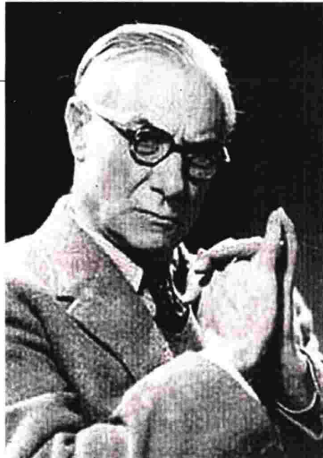
Ο ιστορικός και διπλωμάτης Ε.Χ. Καρ πέθανε το 1982 στα ενενήντα του χρόνια

Για τον συγγραφέα, στο πιο ζουμερό κεφάλαιο του βιβλίου με τον τίτλο Η άνοδος του Στάλιν (σελ. 128-154) «ο Λένιν ποτέ δεν αποδέχθηκε απόλυτα την αντίληψη που θέλει την κομματική ηγεσία αλάνθαστη... Η πίστη στο αλάθητο του κόμματος, στο αλάθητο του Λένιν και κατ' επέκταση του Στάλιν, είναι οπωσδήποτε μεταγενέστερα φαινόμενα. Ο Καρ επιμένει ότι «όταν το 1921 το κόμμα είχε καταδικάσει ρητά τις ομαδοποιήσεις και τη δυνατότητα να ασκεί κάποιος έμπρακτα αντιπολίτευση, σκοπός του ήταν να ατσαλώσει την ενότητά του και τη νομιμοφροσύνη των μελών του... όμως αυτή η υποχρέωση δεν επεκτεινόταν και στα μη μέλη του κόμματος» (σελ. 213). Τα ίδια όμως τα γεγονότα που περιγράφει στο βιβλίο τον διαψεύδουν. Η αρχή της ομοφωνίας, η κατάργηση της Συντακτικής Συνέλευσης, ο Πολεμικός Κομμουνισμός και η Νέα Οικονομική Πολιτική - ΝΕΠ ως το αντίθετο του, η επακολουθήσασα κολεκτιβοποίηση ως το