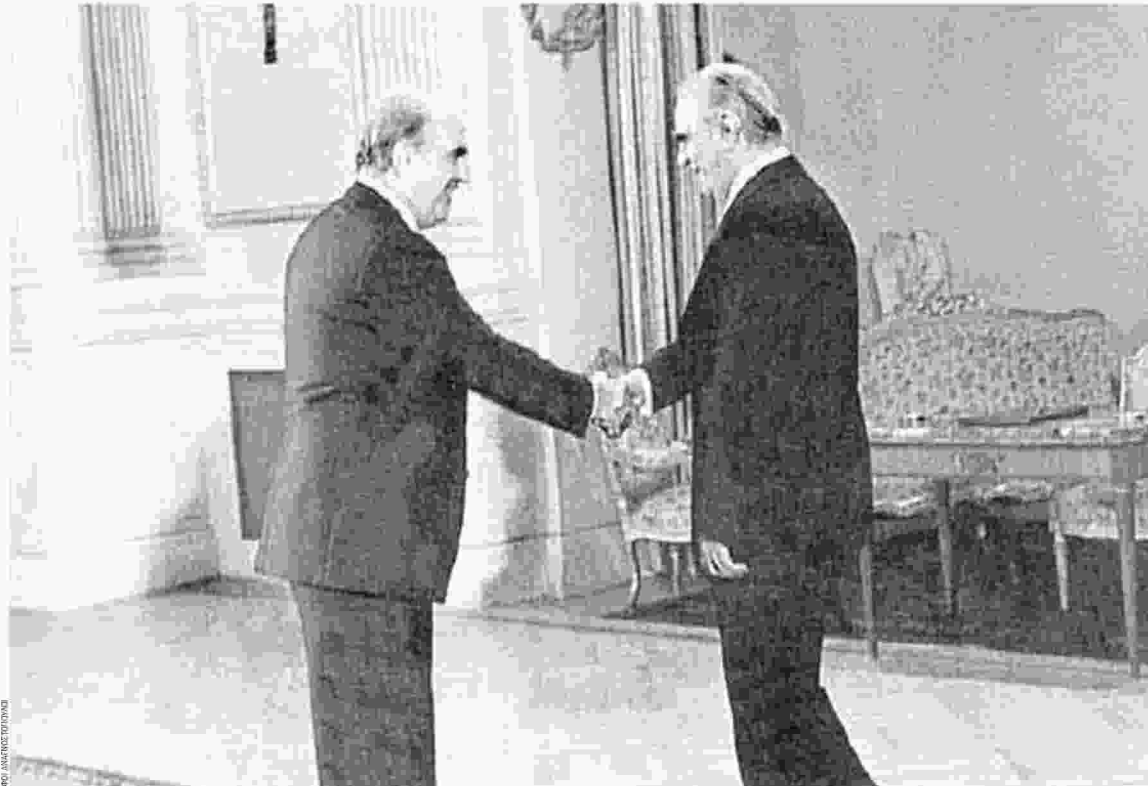
21 Οκτωβρίου 1981: ο νέος πρωθυπουργός της χώρας Ανδρέας Παπανδρέου ανταλλάσσει χειραψία με τον Πρόεδρο της Δημοκρατίας Κωνσταντίνο Καραμανλή, αμέσως μετά την ορκωμοσία της πρώτης κυβέρνησής του ΠΑΣΟΚ.

Στις δύο αυτές μελέτες του Θ. Βερέμη που οργανώνονται στη βάση της αντιπαράθεσης ορισμένων προβληματικών «ζευγαριών» της ελληνικής ιστορίας, όπως ο Αλ. Μαυροκορδάτος με τον Θ. Κολοκοτρώνη, ο Ελ. Βενιζέλος με τον Κωνσταντίνο Α' ή ο Κωνσταντίνος Καραμανλής με τον Ανδ. Παπανδρέου, ο έμπειρος ιστορικός μοιάζει να ξεκινά από την εξής παραδοχή: Σε μια παραδοσιακή κοινωνία/κοινότητα, όπως η ελληνική, έντονα πατερναλιστική, κατακερματισμένη και πελατειακή, οι εκάστοτε ηγεσίες έρχονται να λειτουργήσουν ως πατριάρχες και πατέρες, αν και μέσα από μια πατριαρχική/οικογενειακή δομή. Πολύ σχηματικά, μπορεί να δει εδώ κανείς δύο μεγάλα κι εντελώς αντιθετικά πατριαρχικά πρότυπα ηγεσίας: το ένα, του φιλελεύθερου «παιδαγωγού» που καθοδηγεί, το περιέγραψε εύληπτα ο Ελ. Βενιζέλος όταν έλεγε: «Ο ελληνικός λαός έχει μεγάλες αρετές, είναι εργατικός και εγκρατής και έχει ευφυΐαν και πατριωτισμόν, το πολιτεύμα του όμως και η δημαγωγία των πολιτικών του τον έκαμαν πολύ ατομιστήν και αδιάφορον για το γενικόν συμφέρον».