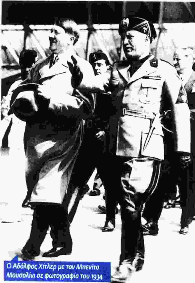
Ο Αδόλφος Χίτλερ με τον Μπενίτο Μουσολίνι σε φωτογραφία του 1934

να τον σκοτώσουν, επομένως η ανακάλυψη της αλήθειας απαιτεί αρκετή δουλειά.