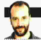
ΓΡΑΦΕΙΟ ΝΙΚΟΛΑΣ ΖΩΗΣ