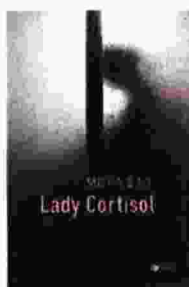
Μισέλ Φάις Lady Cortisol. Εκδόσεις Πατάκη σελ. 128