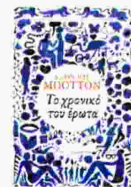
Alain de Botton ΤΟ ΧΡΟΝΙΚΟ ΤΟΥ ΕΡΩΤΑ

και κοινωνικές αναγκαιότητες συνάφθησαν συσσωρευμένη κοινωνική εμπειρία, στο ρομαντικό στάδιο της ταύτισης σεξ και έρωτα. Επειτα ήρθε η μοντέρνα εποχή της απελευθέρωσης εντός των πλαισίων μιας πολυσαχούς κοινωνίας, διαρκώς αναπτυσσόμενης, οικονομικώς ευημερούσας, με αύξοντα αιτήματα ελευθερίας. Και τώρα; Τώρα βρισκόμαστε στο σημείο όπου οι άνθρωποι οφείλουν να αναγνωρίσουν ότι περισσότερο από την υλοποίηση της αγάπης, ο θεσμός του γάμου είναι εκεί για να αντιμετωπίζει τις κακές στιγμές, τις ανεπάρκειες, τις αποτυχίες, τα άχθη της καθημερινότητας και όσα αυτά συνεπάγονται. Είναι ένας ωραίος θεσμός για πρωτίστως άσχημα πράγματα. Μια ρύθμιση που καταφέρνει, όταν πια ένα ζευγάρι ωριμάσει και αποδεχτεί τις διαψεύσεις των φιλοδοξιών του, να σχετικοποιήσει τις έξωθεν απειλές, όπως ερωτικά και άλλα ερεθίσματα που μας βομβαρδίζουν καθημερινά, μια και αυτό που βλέπουμε εκεί έξω και που αποτελεί συχνά το αντικείμενο του πόθου μας δεν είναι παρά μια ιδεατή εικόνα προορισμένη να φθαρεί ύστερα από ένα μισάωρο συνεύρεσης μαζί της.