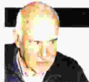
ΓΡΑΦΕΙΟ ΘΑΝΑΣΗΣ Θ. ΝΙΑΡΧΟΣ

Η 69χρονη συγγραφέας από τα Χανιά με το «Τίποτα δεν χαρίζεται» χαράσσει τα όρια ενός σύμπαντος ενώ κινείται φαινομενικά μέσα στην ελληνική συγγραφική και καλλιτεχνική επικράτεια