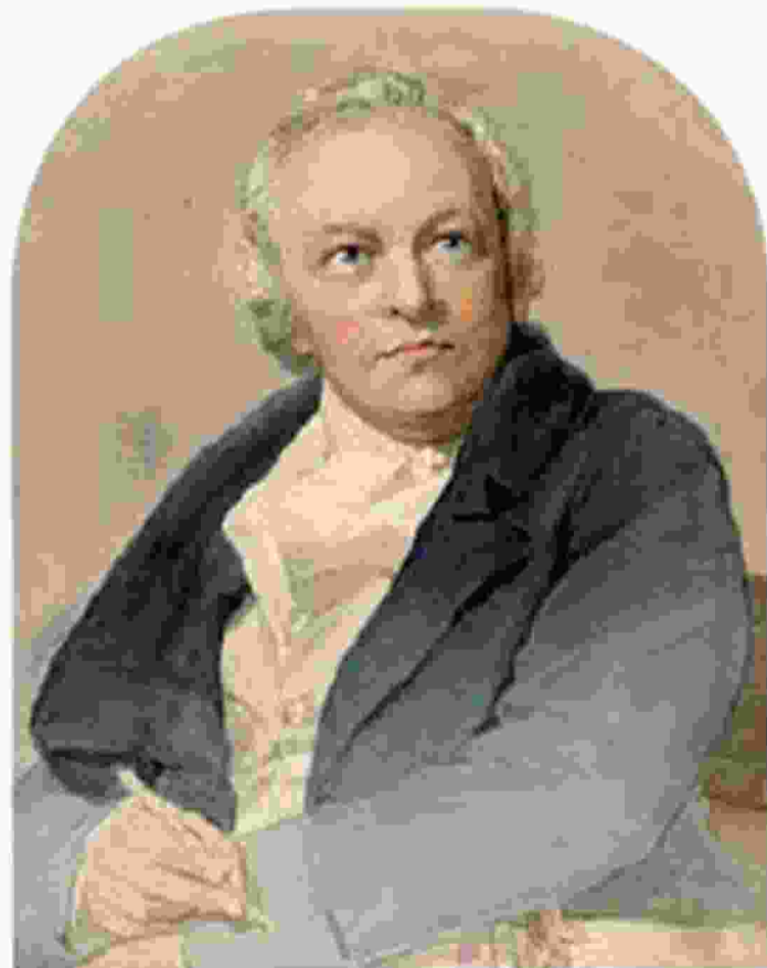
Ουίλλιαμ Μπλέικ , ποιητής, ζωγράφος, πρωτοπόρος χαρακτήρας.

λήσεων ως ανόητος», όπως έχει εξομολογηθεί. Ζωγράφιζε όμως και έγραφε στιχάκια. Κρεμούσε τα καρτιά στους τοίχους του δωματίου της μητέρας του. Έτσι, όταν ήταν 10 ετών, οι γονείς του τον έστειλαν στο Σχολείο Σχεδίου Χένρι Παρς, το καλύτερο στο Λονδίνο. Μετά