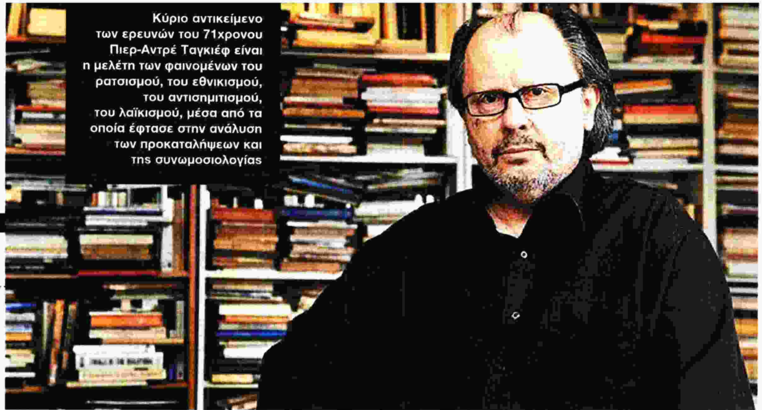
Κύριο αντικείμενο των ερευνών του 71χρονου Πιερ-Αντρέ Ταγκιέφ είναι η μελέτη των φαινομένων του ρατσισμού, του εθνικισμού, του αντισημιτισμού, του λαϊκισμού, μέσα από τα οποία έφτασε στην ανάλυση των προκαταλήψεων και της συνωμοσιολογίας

Pierre - Andre Taguieff ΣΥΝΤΟΜΗ ΠΡΑΓΜΑΤΕΙΑ ΠΕΡΙ ΣΥΝΩΜΟΣΙΟΛΟΓΙΑΣ Μτφ. Σώτη Τριανταφύλλου, εκδ. Πατάκη, 2016, σελ. 382 Τιμή: 16 ευρώ