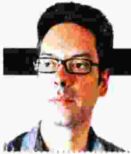
ΓΡΑΦΕΙ Ο ΝΙΚΟΣ ΚΟΥΜΟΥΛΛΗΣ

Ο 71χρονος παριζιάνος πολιτικός επιστήμονας, φιλόσοφος και ιστορικός εξετάζει την επιρροή της συνωμοσιολογικής πρακτικής στις δυτικές κοινωνίες