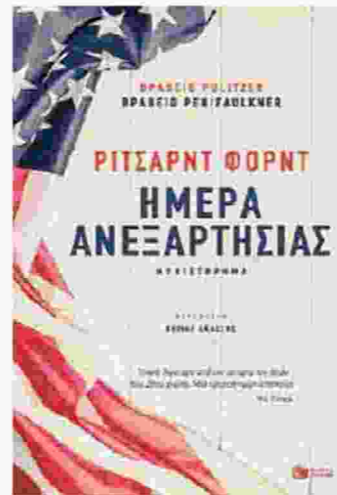
Το δεύτερο μέρος της άτυπης τριλογίας του συγγραφέα.

Στο πρώτο μέρος της τριλογίας, ο Φρανκ, από επίδοξο διηγηματογράφο θα βρεθεί