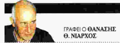
ΓΡΑΦΕΙ Ο ΘΑΝΑΣΗΣ Θ. ΝΙΑΡΧΟΣ

Με επίφαση την τρομοκρατία, ο συγγραφέας σπίνει ένα συναρπαστικό και αληθινά κοσμοπολίτικο μυθιστόρημα, που σκοπό έχει να αποκαλύψει τα υπαρξιακά αδιέξοδα και το σαράκι των σύγχρονων κοινωνιών