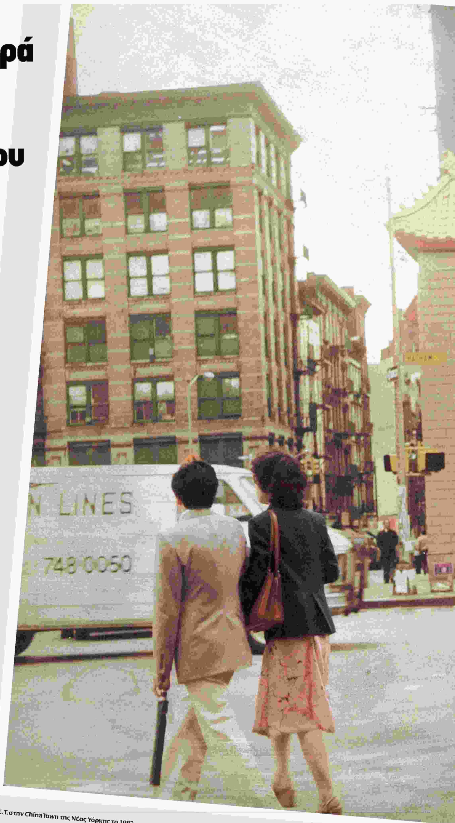
Η Σ.Τ. στην China Town της Νέας Υόρκης το 1982