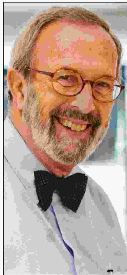
INFO Το βιβλίο του Γιώργου Μαυρογορδάτου 1915, Ο Εθνικός Διχασμός κυκλοφορεί από τις εκδόσεις Πατάκη.

Ακόμη και αυτή την περίοδο εξακολουθεί να υπάρχει ένα γενικότερο πρόβλημα απόστασης μεταξύ λόγων και έργων. Δεν σηκώνουμε μύγα στο σπαθί μας για την ονομασία της Μακεδονίας ή για τα σύνορά μας, αλλά όταν έρθει η κρίσιμη στιγμή κλαίμε και οδυρόμαστε. Όπως όταν είχαμε στείλει ένα πλοίο πριν από αρκετά χρόνια στον Περσικό Κόλπο και στο λιμάνι ζήσαμε στιγμές αρχαίας τραγωδίας.