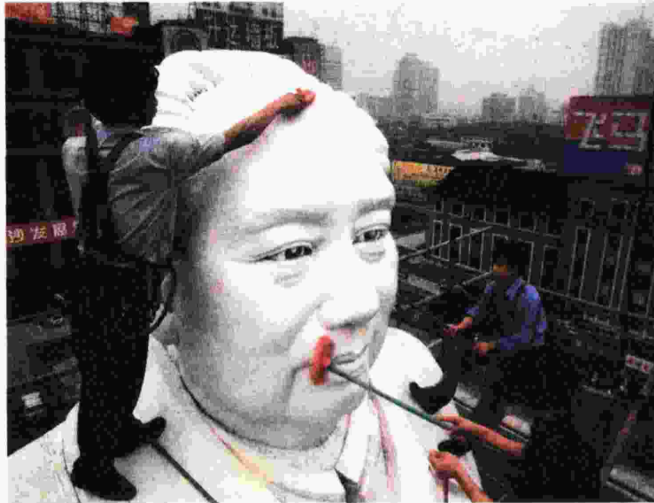
Το μεγαλύτερο άγαλμα του Μάο, στην Τσενγκτού, καθαρίζεται για την 50ή επέτειο της Λαϊκής Δημοκρατίας της Κίνας, 1999. Η μαοϊκή προπαγάνδα του Μπαντιού είναι αδύνατον να μετατραπεί σε φιλοσοφία, διότι όπως γράφει ο Μάο στο Κόκκινο Βιβλίο: «...Στην κατάλληλη θερμοκρασία ένα αυγό μεταβάλλεται σε κοτόπουλο, όμως καμιά θερμοκρασία δεν μπορεί να μετατρέψει μια κοτρώνα σε κοτόπουλο, επειδή η σύσταση κάθε πράγματος είναι διαφορετική». (Τα αποσπάσματα από το Κόκκινο Βιβλίο μεταφράστηκαν από τον Νικήτα Σινιόσογλου, από την δεύτερη αγγλική έκδοση, 1966).

Στο κείμενο «Ο Μάης του '68, σι-ράντα χρόνια μετά» ο Μπαντιού αναφέρεται σε μια άλλη υπό-