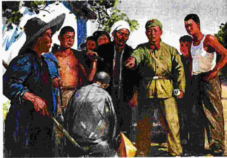
Προπαγανδιστική αφίσα που απεικονίζει την άσκηση «δημόσιας κριτικής», δηλαδή διαπόμπευση, σε «στοιχεία της αντίδρασης», στην Κίνα του Μάο κατά τη διάρκεια της λεγόμενης Πολιτιστικής Επανάστασης. Χωράνε όμως λακανικές και μπλεκετικές αναζητήσεις στην επανάσταση: Ο Μεγάλος Τιμονιέρης προειδοποιεί πως: «Επανάσταση δεν είναι να τρως στα πάρτι, ούτε να γράφεις ένα άρθρο, ή να ζωγραφίζεις έναν πίνακα, ή να κεντάς χειροτεχνήματα: δεν μπορεί να είναι κάτι τόσο εκλεπτυσμένο, ούτε προϊόν σχολής και εξευγενισμού, κάτι τόσο μετριοπαθές, καλοσυνάτο, ευγενικό, μαζεμένο και μεγαλόψυχο. Μια επανάσταση είναι μια εξέγερση, μια πράξη βίας δια της οποίας μια τάξη ανατρέπεται μια άλλη».

Ο Μπαντιού σε ένα «διαλεκτικό» ξεπέραςμα του κράτους-κόμματος και στο πλαίσιο της δικής του απολογητικής για τις μάζες τονίζει: «Για να εξηγηθεί η διολίσθηση της Σοβιετικής Ένωσης στην τρομοκρατία, θα πρέπει να επισημανθεί ένα διαλεκτικό τερατούργημα: ο μαρξισμός-λενινισμός, επινόηση του Στάλιν, ισχυρίζεται ότι υλοποιεί "κομμουνιστικούς" στόχους μέσω ενός κα-