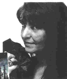
«Ο ΜΟΝΟΦΘΑΛΜΟΣ ΚΑΙ ΑΛΛΕΣ ΠΕΙΡΑΤΙΚΕΣ ΙΣΤΟΡΙΕΣ» της Κατερίνας Καριζώνη. Εκδ. «Καστανιώτη», σελ. 171, € 14.

λογοτεχνική αφήγηση και τη μελέτη των ιστορικών αρχείων της εποχής. Η Κατερίνα Καριζώνη έχει γράψει μεταξύ άλλων και τα μυθιστορήματα: «Ο άγγελός μου ήταν έκπτωτος», «Βαλς στην ομίχλη», «Τσάι με τον Καβάφρη», «Μεγάλο Αγγέρι» κ.ά.