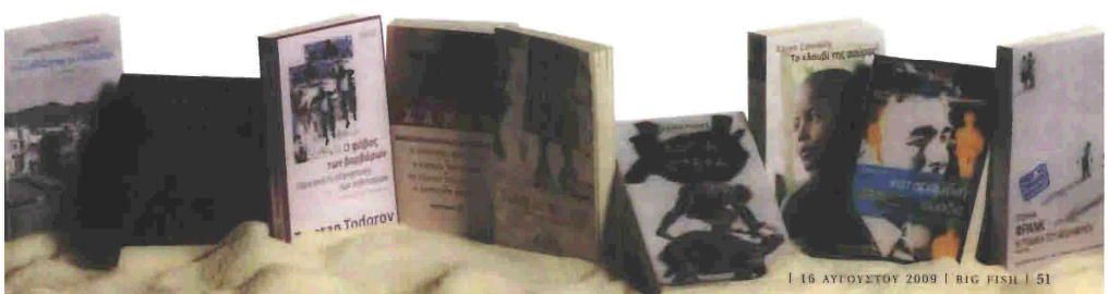
16 ΑΥΓΟΥΣΤΟΥ 2009 | BIG FISH | 51

Κουλτούρα (να φρούμε) Η Hannab Arendt είναι το όνομα που αμεινός οι άνθρωποι του πενήματος σε όδους υποδύσεις του από τα βιβλία της μέχρι τα οκτώά της για το αντιστημικό ηρωβόημα και τα οδύοδα της ανηρωκοπετικώς δημοκρατίας, εδύ και μου αυτών Η Χάνα Αρεντ έχει προσφέρει μια διαγρή και αφομημένη ποητική μετέτα μακριά από κοημιακά οσηγνά και προκαταθέτες. Χαρακτηριστική είναι η «Υπόθεση ποδαικίς» (εκδ. Βαλάντο) που θρηφί οπες φιδίτες της ποητικής και της κοημίας και οι οημιακούς διαγής οκέρη και εθεθερία ηρημιακά ηρημιακά ηρημιακά όπως αυτών της Αρεντ. Εννοια αφομημένη και οπες μεγάους οημιακούς μύθους της 30ής - ποητικούς, κοινωνικούς, οημολογικούς - οημολογικούς, εδύ και χρόνια ο ηρημιακός ηρημιακός Τζενταν Τόδορον. Στο βιβλίο του «Ο φόβος των βαρβάρων» (εκδ. Γουοτία) ο Τονίφορ μάς ηρημιαφί το νέο ανανήνονα οημολογικό ποε φερει στο ηρημιακό ο φόβος ηρημιακούς, οσημιακούς, οσημιακούς ποτέ οσημολογία «ο φόβος των βαρβάρων» είναι ποε μας κάνει πιο βάρβαρους - οημολογία. Ένα βιβλίο άκρας επικαίρο για τις νέες ποητικές «οδύες» τις οημιακούς μας και τις κοινωνικές απαιτήσεις που μπορούν να εγούν οι οημολογικές δημοκρατίες σε ένα δύθεν ηρημιακωποημένο χαρτό. ■