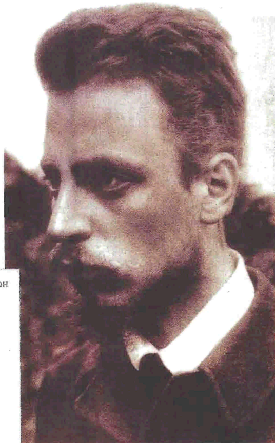
Ράινερ Μαρία Ρίλκε: Ο κορυφαίος Γερμανόφωνος ποιητής του 20ού αιώνα ανθολογείται εξαιρετικά από τον Ούλριχ Μπέερ στο βιβλίο του «Η σοφία του Ρίλκε - Ο οδηγός του ποιητή για τη ζωή» (αριστερά το εξώφυλλο).

σκεπών και η απερισκεψία των σφόν, ούτε ανεβαίνει τη σκάλα της αγάπης προσηλαθόντας να φτάσει το Καλό, όπως έκανε ο Σωκράτης στο έργο του Πλάτωνα. Ο Ούλριχ Μπέερ εκθέτει εδώ τις γλυκόπικρες αντιλήψεις του Ρίλκε για την ανθρώπινη επιθυμία, καθώς και την ποιητική της απόληξης που τη διαδέχεται».