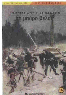
Συγγραφείς: Ρόμπερτ Λούις Στείνσον «Το μαύρο βέλος» Μτφ: Μαίρη Κτισπούλου Εκδόσεις: ΚΑΣΤΑΝΙΩΤΗ

Σ ε κάποιο αγρόκτημα της φεουδαρχικής Αγγλίας, την ηρεμία ταράζει ένα σμήνος από πουλιά που σηκώνονται ξαφνικά μέσα στο δάσος. Το επόμενο κίλας λεπτό ένα βέλος σκοτώνει τον Άπλιγαντ. Είναι σταλμένο από τους παράνομους του Μαύρου Βέλους που ζουν στα σκοτεινά δάση του Τάνστολ, ορκισμένοι να αποδώσουν δικαιοσύνη και να εκδικηθούν τον σερ Ντάνιελ Μπράκι. Με φόνο το πολυτάραχο σκηναίο του Πολέμου των Ρόδων ανάμεσα στους Οίκους του Γιορκ και του Λάνκαστερ, ο Στίβενσον αφηγείται την ιστορία του Ρίτσαρντ Σέλτον, ο οποίος ανακαλύπτει αιγά αιγά το μυστικό που συνδέει τον ίδιο με τον σερ Ντάνιελ Μπράκι και με την αγαπημένη του Τζζάνα, που βρίσκεται φυλακισμένη στο κάστρο του σερ Ντάνιελ. Η δυνατή και περιπετειώδης αφήγηση σε συνδυασμό με την πλούσια αλλά και ρομαντική φαντασία του Στίβενσον δημιουργούν ένα μυθιστόρημα από εκείνα που δεν έπαψαν ποτέ να συγκινούν τις καρδιές των ανθρώπων.