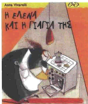
Συγγραφείς: Anna Vivarelli «Η Έλενα και η γιαγιά της» Εικόνες: Anna Laura Cantone Μτφ: Άννα Παπασταύρου Εκδόσεις: ΜΕΤΑΙΧΜΙΟ

Η επιλογή του επαγγέλματος συνιστά ίσως την κρίσιμότερη απόφαση που παίρνει ένας άνθρωπος στη ζωή του, ιδιαίτερα σήμερα που επικρατεί ρευστότητα στα επαγγέλματα, υψηλή ανεργία, ευελιξία στις εργασιακές σχέσεις και την αγορά εργασίας. Μέσα σ' αυτό το όλο πιο δύσκολο και τραχύ τοπίο, οι νέοι άνθρωποι ζητούν πληροφορίες για τις επαγγελματικές επιλογές που έχουν στη διάθεσή τους. Το βιβλίο αυτό φιλοδοξεί να καλύψει αυτό το κενό. Δίνει συνοπτικά, με συστηματικό και απλό τρόπο, τις βασικές επαγγελματικές επιλογές που ανοίγονται σε κάθε νέο άνθρωπο. Πρόκειται για μια επίμονη και τεκμηριωμένη συλλογή του βασικού χάρτη των επαγγελμάτων που υπάρχουν σήμερα στη χώρα μας. Παράλληλα, στο παράρτημα του βιβλίου παρουσιάζονται οι δημόσιες σχολές για τους πτυχιούχους και ο χάρτης των ειδικοτήτων όλων των βαθμίδων της εκπαίδευσης. Ένα χρηστικός και πρακτικός οδηγός που δίνει τις βασικές και ουσιαστικές πληροφορίες για τα επαγγέλματα.