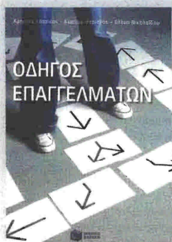
Συγγραφείς: Χρήστος Κάτσικας - Κώστας Θεριανός - Ελένη Νικολαΐδου «Οδηγός επαγγελματιών» Εκδόσεις: ΠΑΤΑΚΗ

Επιμέλεια: Κωστούλα Ταμοδάκη info@isfina.gr