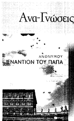
«Εναντίον του πάπα» Του Ανώνυμου Εκδόσεις Πατάκη

Το βιβλίο αυτό, που εκδόθηκε ανώνυμα στην Ιταλία στην πρώτη επίθεση της εκλογής του Γότσεφ Ράτσιγκερ στον παπικό θρόνο, ξεσήκωσε θύελλα, έγινε μπεστ σέλερ και ανατυπώνεται, ενώ εμπλουτίζεται διαρκώς και μεταφράζεται στις μεγαλύτερες γλώσσες του κόσμου. Το αντικείμενο του είναι, προφανώς, ο σημερινός παπικός: η ηθική και φιλοσοφική του υπόσταση. Ο ανώνυμος συγγραφέας σχολιάζει τις διδασκαλίες, τις θεολογικές διαλέξεις και τα κηρύγματα του Βενέδικτου ΙΣΤ', από την αφιγή του στη Ρώμη το 1981 μέχρι την πρώτη εγκύκλιο τον Ιανουάριο του 2006. Διατρέχει το βίο και την ποίητα του Γερμανού πάπα, αναλύοντας το επικοινωνιακό του πρόσωπο και αποκάλυπτοντας τα τεκταινόμενα στους διαδρόμους του Βατικανού! Πέρα όμως και πάνω απ' όλα, εξετάζει μερικά από τα πιο δραματικά, πνευματικά και σημαντικά θέματα του σύγχρονου κόσμου, μέσα από τις αντιδράσεις και τις θέσεις του σημερινού πάπα: από την ανασυλλήπιση και τις αμβιβολίες ως τη σεξουαλική κακοποίηση στους κόλπους