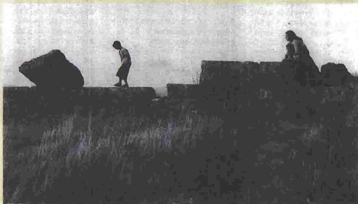
Φωτογραφία του Σωτήρη Λόμπρου από το βιβλίο «Το πέτρινο δάσος»

Το γνωστό ατού της συγγραφέως, δηλαδή η σκωπτική αποτύπωση κάποιων καταστάσεων, είναι πανταχού παρόν. Ο παιδικός συλλογισμός της περίπου εννιάχρονης Δίλης, όταν πηγαίνει μαζί με τον αδελφό της Κάρολο να δούνε την ταινία Φαντασία : «...σκέφτηκε πως αν υπήρχε Θεός, θα τον έδειχνε η Φαντασία , αφού τους έδειχνε όλους, και τους δεινόσαυρους ακόμα», αποτυπώνει αφ' ενός την παιδική αθωότητα, αλλά και τη διεισδυτική ματιά της συγγραφέως. Οι κοσμογονικές –για τη Δυτική Ευρώπη και τη Βόρειο Αμερική– αλλαγές της δεκαετίας εντοπίζονται, αλλά από το πρίσμα μιας πολύ μικρής μερίδας Ελλήνων. Εν τω μεταξύ, τα προβλήματα της γενέθλιας χώρας είναι τόσο πολλά που η μετοίκηση της οικογένειας στο εξωτερικό (στην Αγγλία) τα απαλύνει μεν, αλλά δεν τα αφανίζει από τη σκέψη τους.