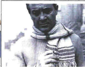
ΚΩΣΤΑΣ ΤΑΧΤΗΣ Το τρίτο στεφάνι (νέα έκδοση) (εκδόσεις Γαβριηλίδης)