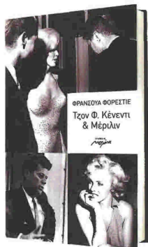
Τρον Φ. Κένεντι και Μέρλιν Φρανσουά Φορετιέ Μετάφραση Ρίτα Κολαίτη Εκδόσεις Μελένι 320 σελίδες, €17

Η ιστορία μαζεύει γκισσάτη. Η πιο παθιτή απαρ του Χόλγουιντ και ο πιο χαρισματικός πρόεδρος των Ηνωμένων Πολιτειών είναι μια σκόπη που κρέμασε δέκα χρόνια προτού μετατραπεί σε ένα στενά παρακλουδιό μου story. Τους προγραφοίσε η μαρία, τους κρυφακούσε η ΚΟΒ. Η CIA βρισκάντα στο κατόπι τους, οι ερασιτέχνες δεν ήταν πατέ μόνι. Κράτος-ιδωναθλαίρις, εκδιασοί, δοκολοκικές, ενλογκά μαγερέματα, βρόμικα χρέλια, απί όλα είσε ο μπας-ξες, η Μέρλιν Μονρόε, στο χελός της τρέλος και ο Τρον Φ. Κένεντι, στα πρόβρα του ακανάλου, σμίγουν. Και, ίσως, αγαπιούνται. Ενώ ο πρόεδρος ακούει η Μέρλιν να τραγουδάει το «Happy birthday», ο ακιωδής πόλεμος μάεται. Θα υπάρξουν νεκροί.