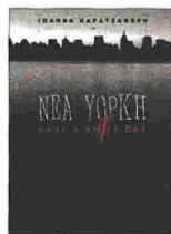
«ΝΕΑ ΥΟΡΚΗ ΗΒΕΡΕΤΕΣ» της Ιωάννας Καρτζαφέρη, εκδόσεις: Libro, σελ.: 248, τιμή: €18

Απρόβλεπτες, σοκαριστικές και ρυθμικές, δέκα ιστορίες για τη ζωή και τον θάνατο με την ανεξάντλητη φρεσκάδα της συγγραφέως. Οι ήρωες που δρουν στις ιστορίες κινούνται στην ακούραστη Νέα Υόρκη, ενώ ένας αδιόριστος δεσμός με την ελληνικότητα της γραφής, της Καρτζαφέρη, περιπλέκει ακόμα περισσότερο τα πράγματα.