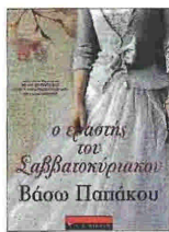
«Ο ΕΡΑΣΤΗΣ ΤΟΥ ΣΑΒΒΑΤΟΚΥΡΙΑΚΟΥ» της Βάσως Παπάκου, εκδόσεις: Λιβάνη, σελ.: 388, τιμή: €17,99

Ένα μυθιστόρημα που αφηγείται την ιστορία μιας οικογένειας από τις αρχές του εικοστού αιώνα έως τον Β' Παγκόσμιο Πόλεμο. Μέσα από το χρονικό της οικογένειας, ο αναγνώστης παρακολουθεί την ιστορία της Ελλάδας στα πιο κρίσιμα και ταραγμένα χρόνια της.