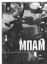
«ΜΠΑΜ» του Κωνσταντίνου Ακύλα, εκδόσεις: Κέδρος, σελ.: 241, τιμή: €14