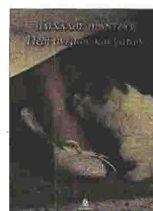
«ΠΕΡΙ ΑΝΕΜΩΝ ΚΑΙ ΓΑΤΩΝ» του Πασχάλη Πράντζου, εκδόσεις: Ωκεανίδα, σελ.: 395, τιμή: €16

Απρόβλεπτες, σοκαριστικές και ρυθμικές, δέκα ιστορίες για τη ζωή και τον θάνατο με την ανεξάντλητη φρεσκάδα της συγγραφέως. Οι ήρωες που δρουν στις ιστορίες κινούνται στην ακούραστη Νέα Υόρκη, ενώ ένας αδιόριστος δεσμός με την ελληνικότητα της γραφής, της Καρτζαφέρη, περιπλέκει ακόμα περισσότερο τα πράγματα.