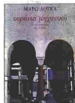
«ΟΥΡΑΝΙΑ ΜΗΧΑΝΙΚΗ» της Μάρως Δούκα, εκδόσεις: Πατάκι, σελ.: 528, τιμή: €24,50