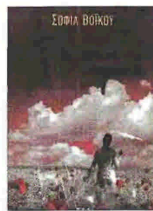
«ΤΟ ΚΟΚΚΙΝΟ ΣΗΜΑΔΙ» της Σοφίας Βόικου, εκδόσεις: Ψυχογιός, σελ.: 464, τιμή: €17,70

Ο Νίκος βρισκόταν σε κόμα τις τελευταίες είκοσι ώρες. Ενώ ήταν έτοιμος να παραδοθεί, ο Εκτορας τον χαστούκισε και ξύπνησε. Στις επόμενες μέρες συνήλθε. Έτσι τουλάχιστον νόμιζε. Όταν αποφάσισε όμως πως ήταν πια καιρός ν' αλλάξει τον εαυτό του, κατάλαβε πως βρισκόταν σε κόμα όχι είκοσι ώρες αλλά είκοσι χρόνια. Μπαμ.