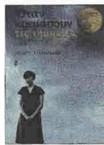
«ΟΤΑΝ ΚΡΕΜΑΣΟΥΝ ΤΙΣ ΟΜΟΡΦΕΣ» του Μάνου Τσιλιμπίδη, εκδόσεις: Καστανιώτη σελ.: 112, τιμή: €9

Η Χαρά κατάφερε να παντρευτεί τον άντρα που ονειρεύτηκε. Ενώ όμως του στάθηκε στα δύσκολα, μόλις εκείνος έπεσε να ζει στην αβεβαιότητα, ανακάλυψε πως η πολύποθη σταθερότητα συνοδεύεται από βαθιά πλήξη. Η αντίδρασή του πόνεσε τη Χαρά, που είχε μάθει να πετάει με τα δικά του φτερά.