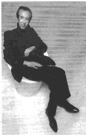
ΕΠΙΣΤΗΜΗ: Κ. ΔΑΜΑΝΤΙΝΙΟΥ