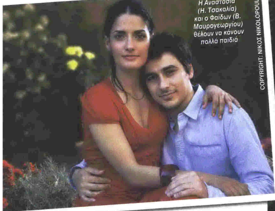
Η Αναστασία (Η. Τσακαλία) και ο Φαίδων (Β. Μαυρογεωργίου) θέλουν να κάνουν πολλά παιδιά