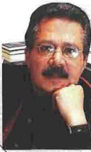
Από τον Δημήτρη Μπουραντά