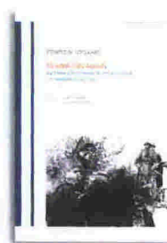
Στράτος Ν. Δορδανάς Το αίμα των αθών Βιβλιοπωλείον της Εστίας